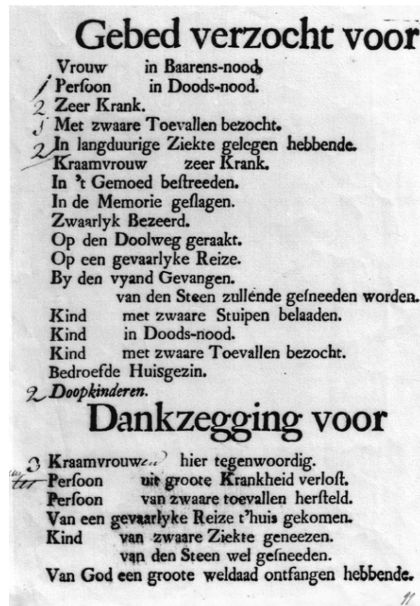
Het formulier voor gebeden en dankzeggingen.