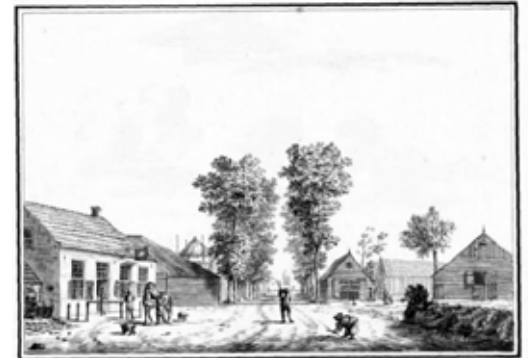
Herberg De Steene Kamer (F.H. de Witte, 1783).

Uit de notulen van de kerkenraad blijkt, dat ds. Smith trouw zijn gang door de Gemeente maakt, zowel in ‘het Dorp’ als in de ‘Buurschappen’.